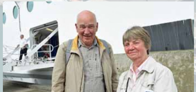
GLADE KRYDSTOGTÆSTER FRA SKIBET BIRKA STOCKHOLM, DER ANLØB RØNNE HAVN I JULI SIDSTE ÅR.

Det er en flot anerkendelse fra gæster, som er vant til et høj service-niveau overalt i det konkurrenceprægede marked i Østersøen.